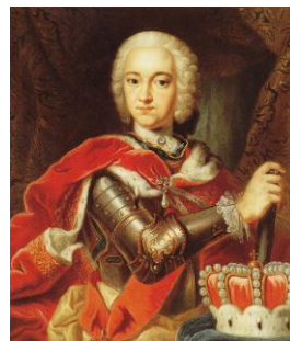
Kurfürst Karl Theodor (1744)

Die Fürsten aus den ver- schiedenen Linien der Wit- telsbacher haben auf vielen Fürstenthronen des Heiligen Römischen Reiches geses- sen, sie hatten in der Neben- linie Pfalz-Neuburg bereits im 17. Jh. durch Erbfolge die Herzogtümer Jülich und Berg einnehmen können. Zudem besetzten sie wichtige Bischöfsstühle im rheinischen Raum. Im Vortrag wer-