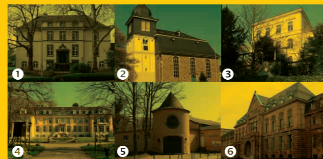
Stationen der Stadttouren im Leverkusener Stadtgebiet:

In allen wupsi Service Centern und bei KulturStadtLev Kasse Forum Leverkusen