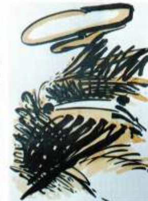
Lilo Röhl: „Zögraphiké/2“ 30x40 cm, Pigmenttinte/Bütten. „Zögraphiké/3“ 40x30 cm, Sepia/Wachs. „Zögraphiké/4“ 40x30 cm, Antiktusche/Gouache.

Der Bilderzyklus „Zögraphiké“ von Lilo Röhl spiegelt das Leben facettenreich. Inspiriert von Zitaten und Gedichten treffen bildnerische Elemente auf Zeichen und Buchstaben. Meditatives Schreiben wird künstlerisch vielseitig umgesetzt zu Bildern voller Poesie. Die Themen Zeit und Vergänglichkeit verdichten sich zu Archetypen Ihrer Bildsprache.